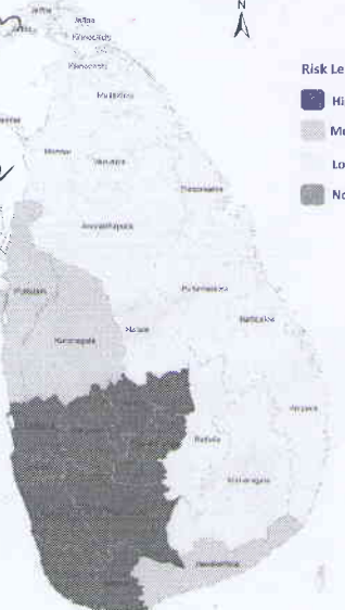
Advisory for Heavy Rain Issued at 09:30 a.m 22 August 2019 Valid for period until 09:30 a.m 23 August 2019

Issued by National Hazards Early Warning Centre Department of Meteorology