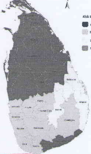
Weather Warning for strong winds Issued at 4:30 a.m on 22 August 2019 Valid for the period until 4:30 a.m on 23 August 2019

Issued by National Hazards Early Warning Centre Department of Meteorology